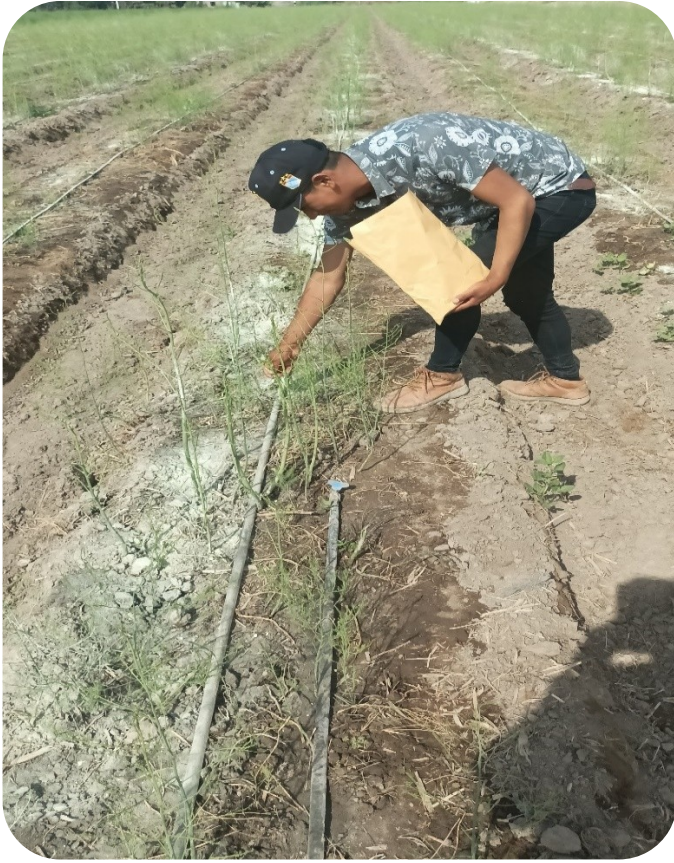
Fig. 5 Toma de muestra foliares