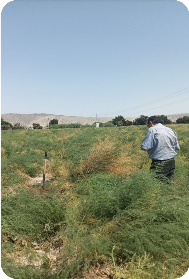
Fig. 8 Recojo de Información del cultivo.