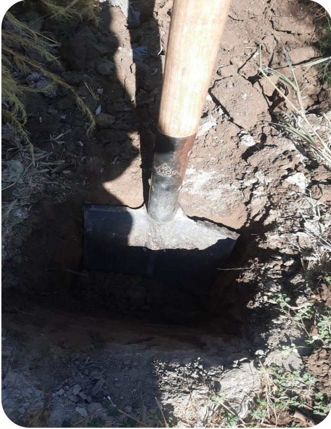
Fig. 7 Toma de muestra de suelo.