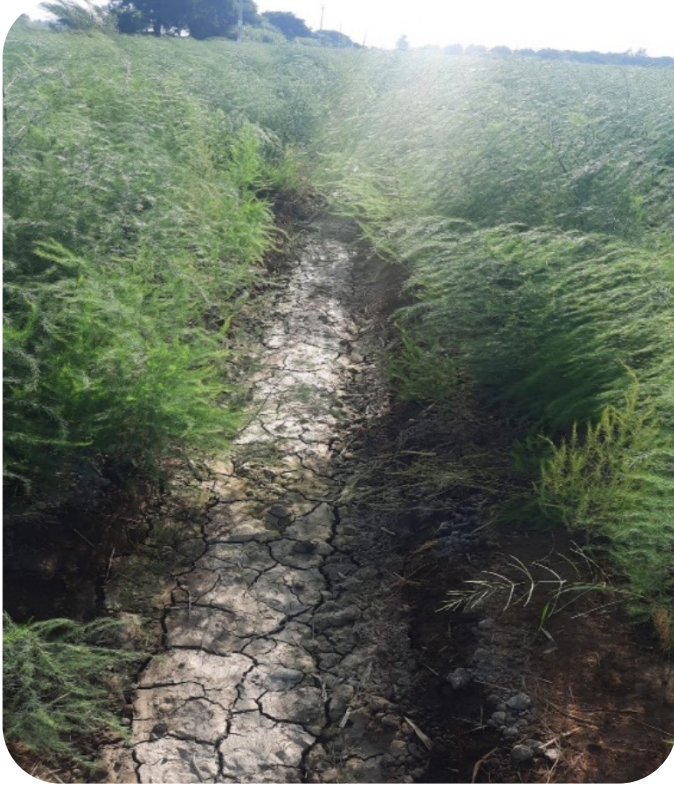
Fig. 6 Desarrollo del cultivo de espárrago.