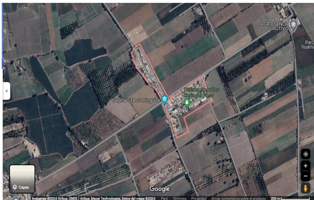
Fig. 1: Ubicación del experimento