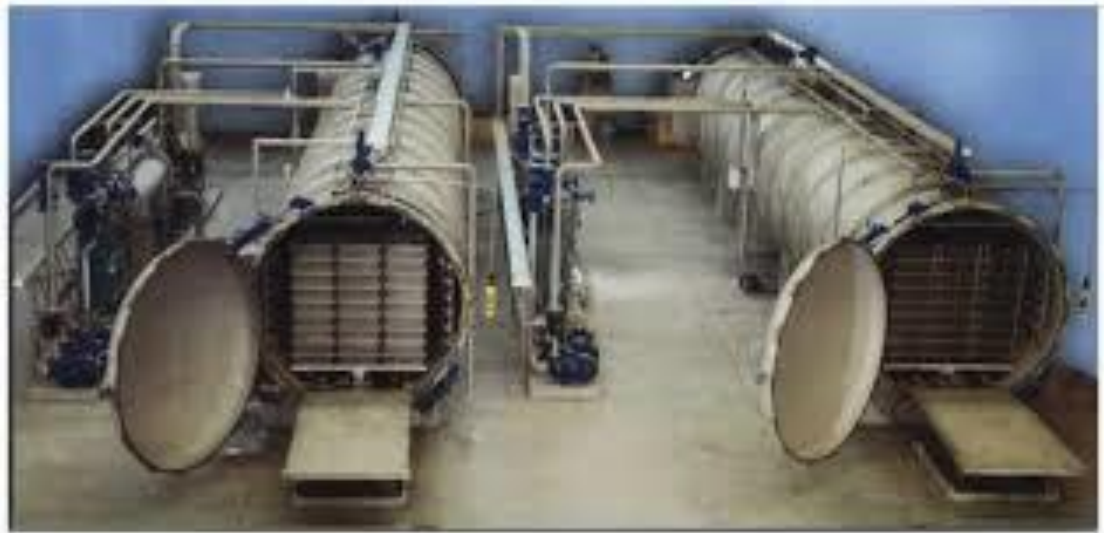
Figura 15. Autoclaves para esterilización

1 hora. Ningún envase debe quedar sin tratamiento al finalizar la producción, y todos los envases que se carguen en la autoclave deben tener las dimensiones iguales, así como el mismo líquido de gobierno y mismo producto. Aunque podría permitirse productos diferentes si se usan cestas diferentes siempre y cuando el proceso fuera idéntico (FAO, 1989).