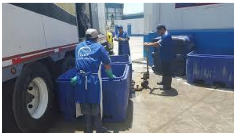
Figura 4. Recepción de materia prima

El muestreo de lote de materia prima para histamínicos, se efectúa a 09 unidades y sólo 02 pueden estar por encima de 20ppm (Recomendación de la Comunidad Europea).