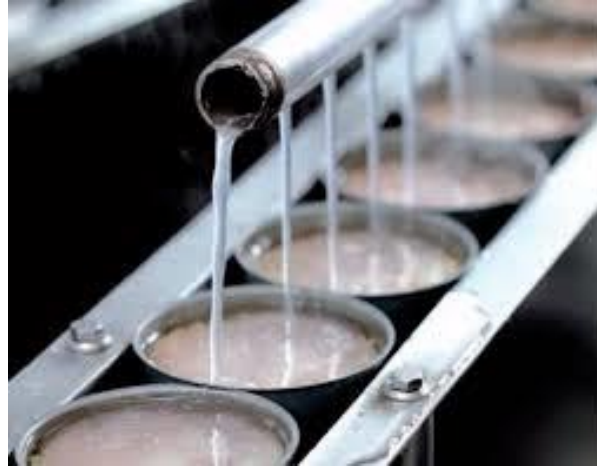
Figura 11. Adición del líquido de gobierno