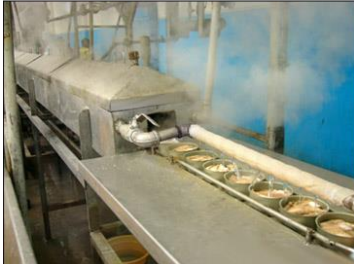
Figura 13. Exhausting de conservas por vapor