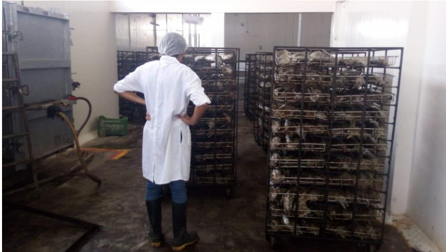
Figura 7. Enfriamiento del Bonito cocido ( Sarda chiliensis chiliensis )