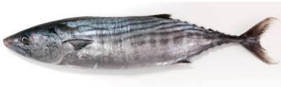
Figura 1. Bonito ( Sarda chiliensis chiliensis )

millo aproximadamente. Según el tamaño del ejemplar la fecundidad aumenta de manera exponencial (Cuvier, 1831).