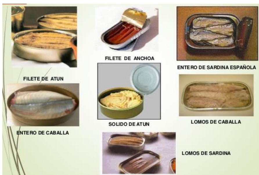
Figura 3. Presentaciones de conserva de pescado