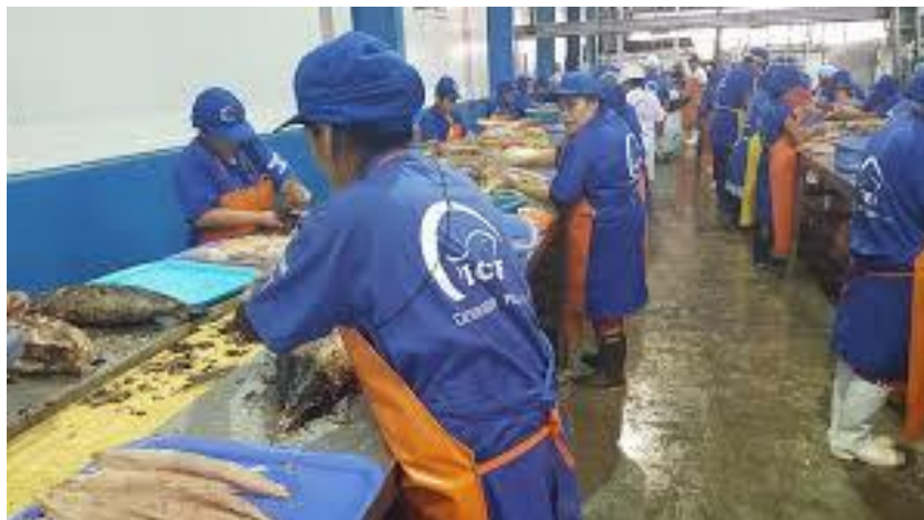
Figura 8. Trozado del Bonito ( Sarda chiliensis chiliensis )