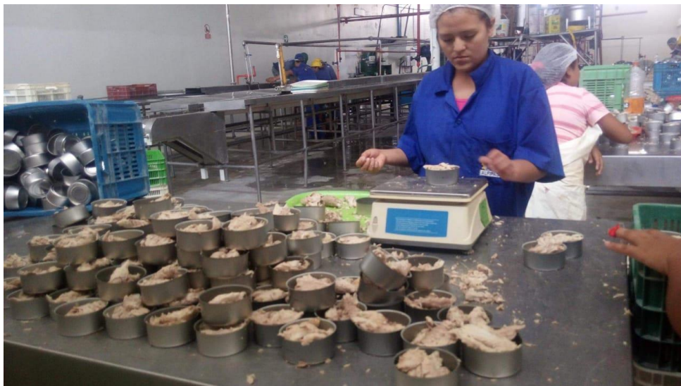
Figura 10. Envasado de Bonito ( Sarda chiliensis chiliensis ) en latas de 1/2 libra

espacio libre o espacio de cabeza. Una vez que se obtiene los filetes, estos se recortan manualmente. Después serán seleccionados y metidos en las latas (Rodríguez, 2007). Se llevarán a la balanza de contrapeso y se añadirá o sacará carne según lo obtenido en la balanza, En este caso es indispensable mantener la integridad del músculo del pescado.