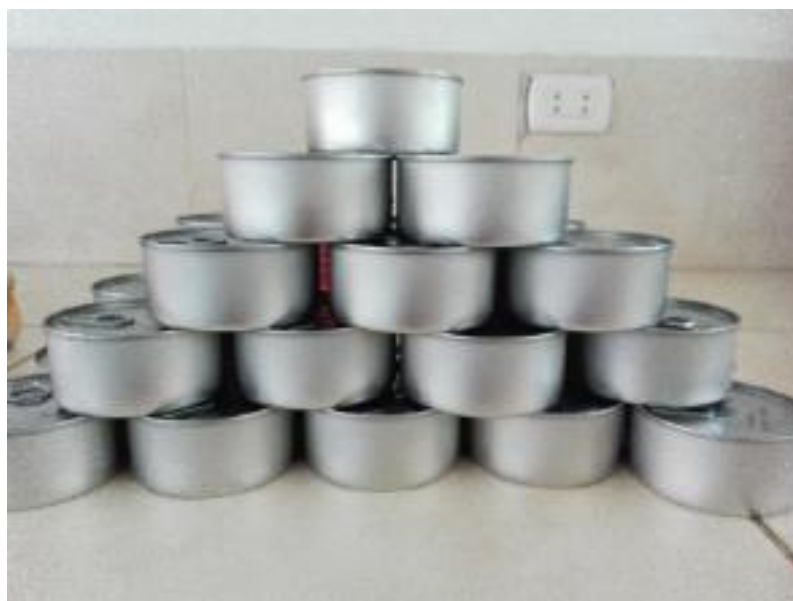
Figura 18. Conserva de Bonito ( Sarda chiliensis chiliensis ) (Producto Terminado)