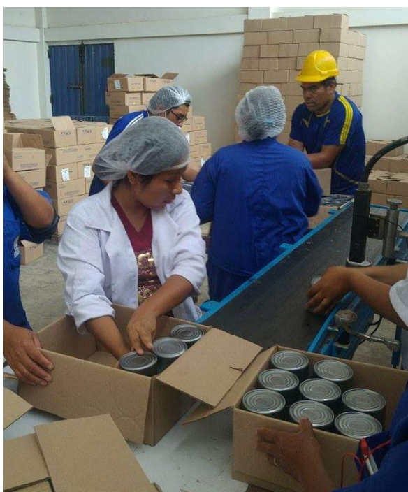
Figura 16. Limpieza y empaque de conservas

El empaque se realizará en cajas de cartón con capacidades de acuerdo a la presentación, para latas de ½ libra en cajas de 48 unidades.