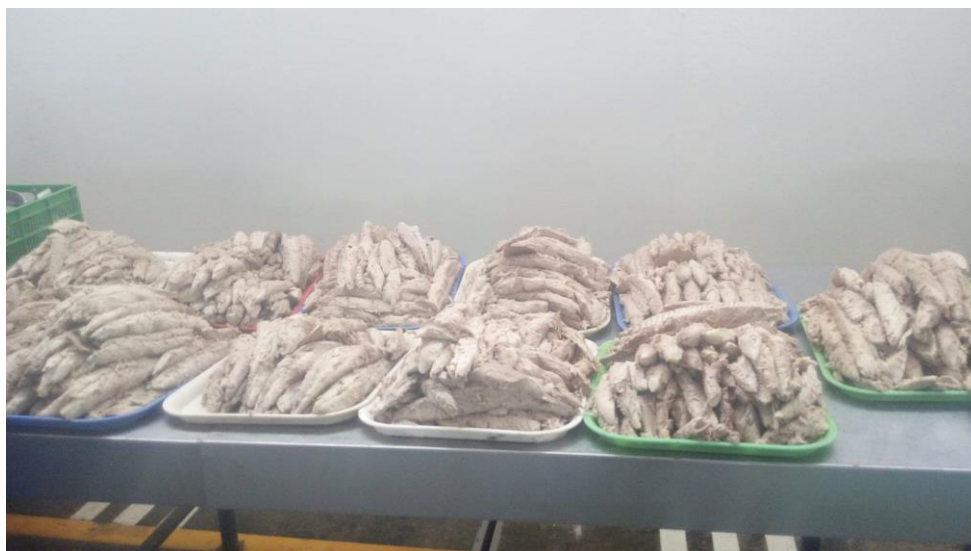
Figura 9. Filetes de Bonito ( Sarda chiliensis chiliensis )