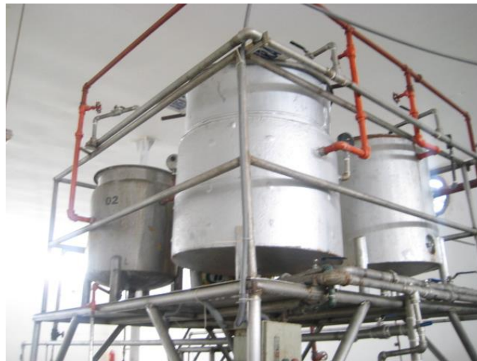
Figura 12. Tanques de preparación del líquido de gobierno