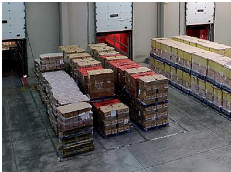
Figura 17. Almacenado de producto terminado