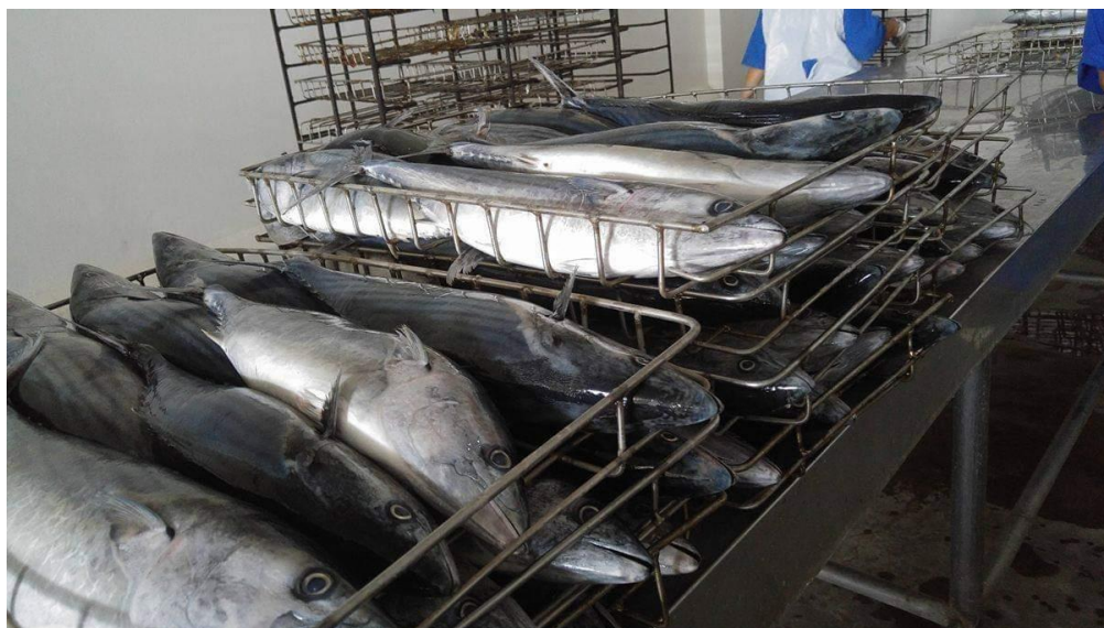
Figura 5. Encanastillado del Bonito (Sarda chiliensis chiliensis)

Las piezas de pescado deberán ser estibadas en las canastillas con el vientre hacia abajo por ningún motivo se estibarán de otro modo por decirlo de costado o con el lomo hacia abajo.