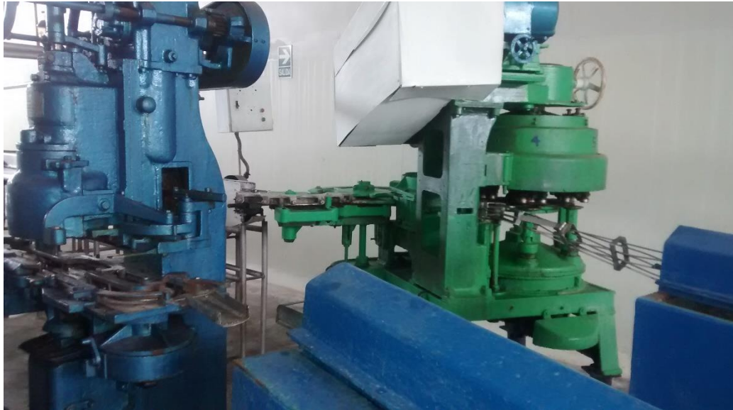
Figura 14. Máquina de sellado de latas

factor muy importante y esencial que se debe controlar. El envase más frecuente para la conserva de pescado es el metálico (hojalata o aluminio) (Lespinard, 2011).