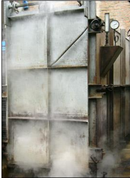
Figura 6. Cocinador a vapor