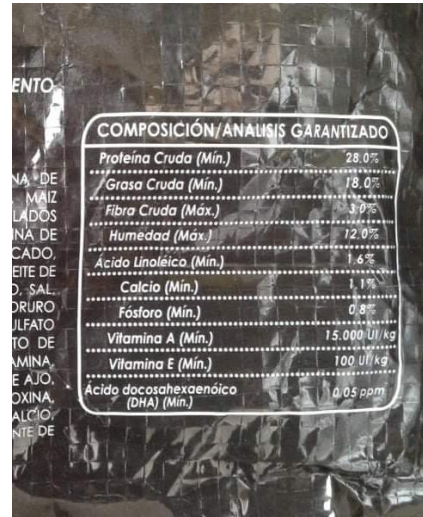
Ilustración 2/Pro Plan Puppy/ Información Nutricional