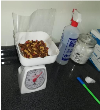
Ilustración 11/-1= Alimento Ricocan (Marca A) /Laboratorio FMVZ