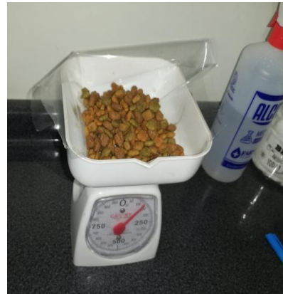
Ilustración 12/T-2= Alimento Dog Chow (Marca B) /Laboratorio FMVZ