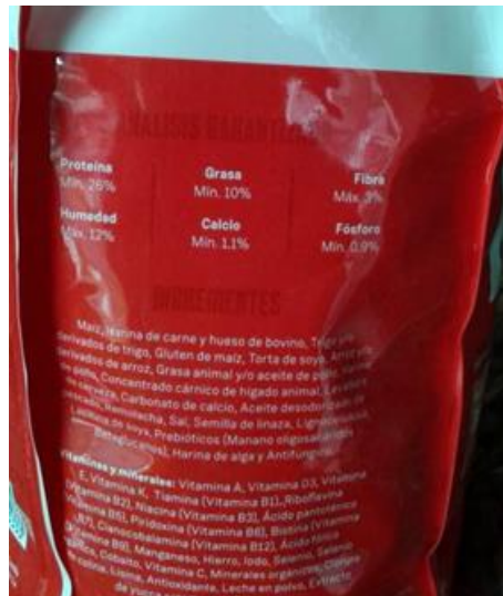
Ilustración 4/Riocan Babycan/Información Nutricional