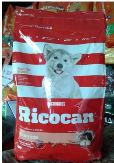
Ilustración 3/Riocan Babycan/Carne Leche