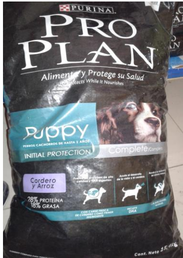
Ilustración 1/Pro Plan Puppy/Cordero