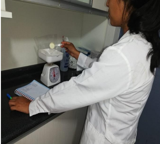
Ilustración 16/Sustituto Lácteo/Laboratorio FMVZ