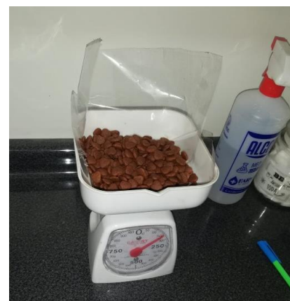
Ilustración 14/ T-4= Alimento Royal Canin (Marca D) /Laboratorio FMVZ