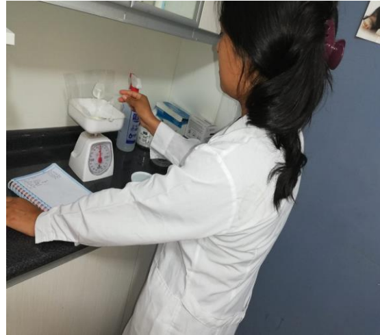
Ilustración 17/ Sustituto Lácteo/Laboratorio FMVZ