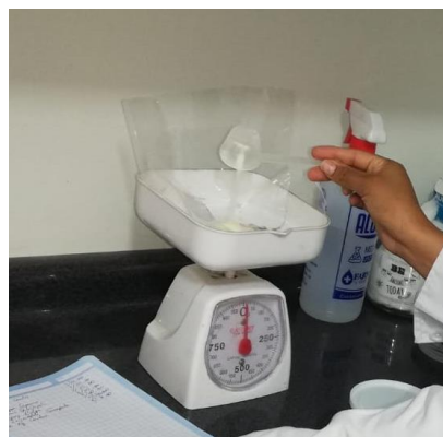
Ilustración 12/ T-5= Leche materna/Laboratorio FMVZ