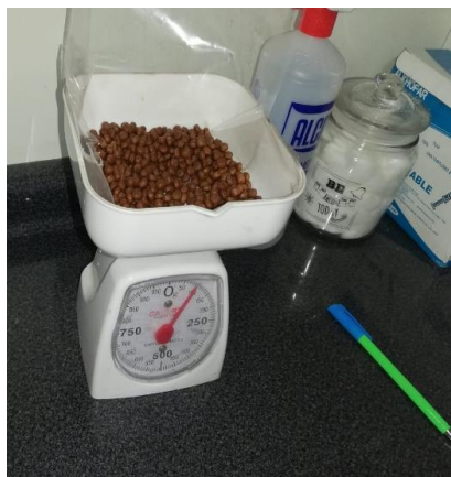
Ilustración 13/T-3= Alimento Pro Plan (Marca C) /Laboratorio FMVZ