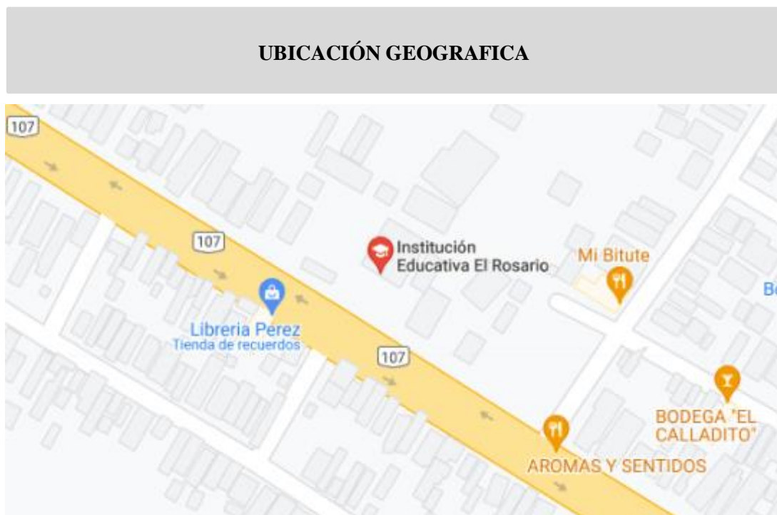
Figura 1: Ubicación satelital de I.E. N°22511