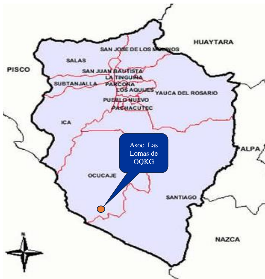
Figura: ubicación del campo experimental

El experimento se realizó en un vivero artesanal de la señora Rosa Salazar ubicado en la Asociación de vivienda “Las Lomas de Ocucaje”, perteneciente al distrito de Ocucaje (zona baja), provincia y departamento de Ica, caracterizada por un clima árido, con temperaturas promedio entre 25 °C y 32 °C, escasa precipitación y alta radiación solar. Las condiciones de riego fueron controladas por sistema de riego manual con frecuencia regular (según necesidad hídrica observada en las plántulas).