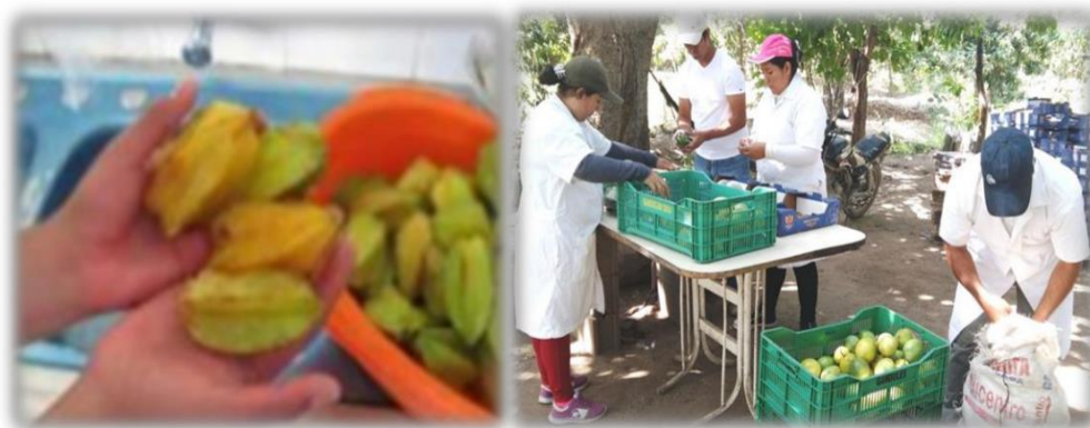
Figura 6: R.M.P

Personal encargado realizara inspección previa del estado de la fruta con inspecciones al azar, cuya revisión debe consistir en una inspección visual, si se encontrase muy madura, si presentan algún tipo de daño ya sea por sol, corte, no presentar daños por descomposición, presencia de mohos ya que estos generan una cierta resistencia al tratamiento térmico y cuando se efectúa el envasado genera la pérdida del néctar, entre otros. Controlar el ingreso del producto nos da la seguridad de que el producto final será de calidad. Castillo (2005)