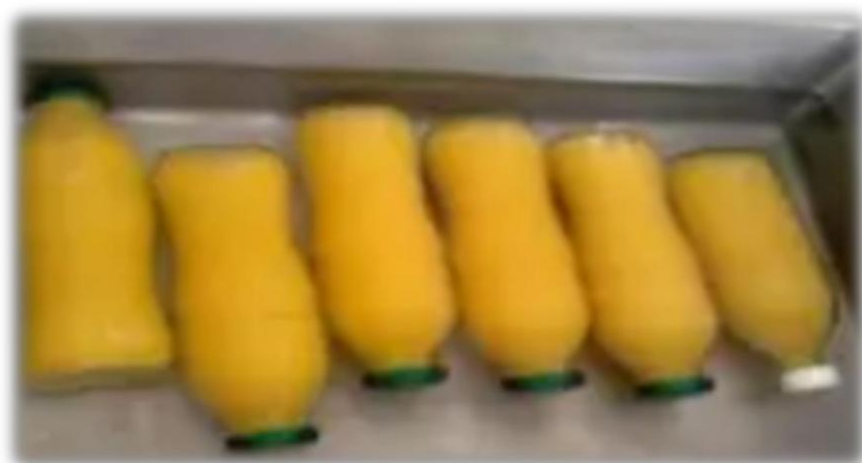
Figura 17: Enfriado

Operación que consiste en enfriar el producto utilizando agua potable hasta obtener una temperatura ambiente.