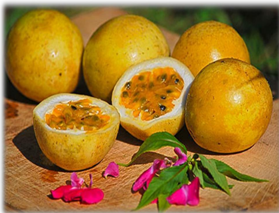
Figura 2: Maracuyá Amarillo

Únicas variedades: el amarillo ( Passiflora edulis ) y morado ( Passiflora edulis ) (MINAG, 2009).