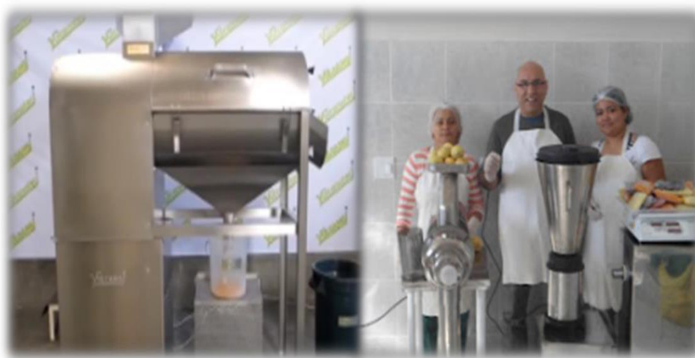
Figura 12: Pulpeado

Esta se obtiene separando la cascara y la mayor cantidad de sólidos (fibras, semillas, partículas extrañas). Las maquinas pulpeadoras se utilizan industrialmente. A nivel semi-industrial la trituración se puede hacer en licuadora (Castillo y Rojas, 2005).