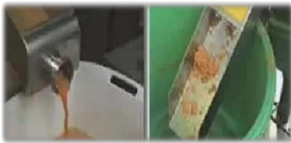
Figura 13: Refinado