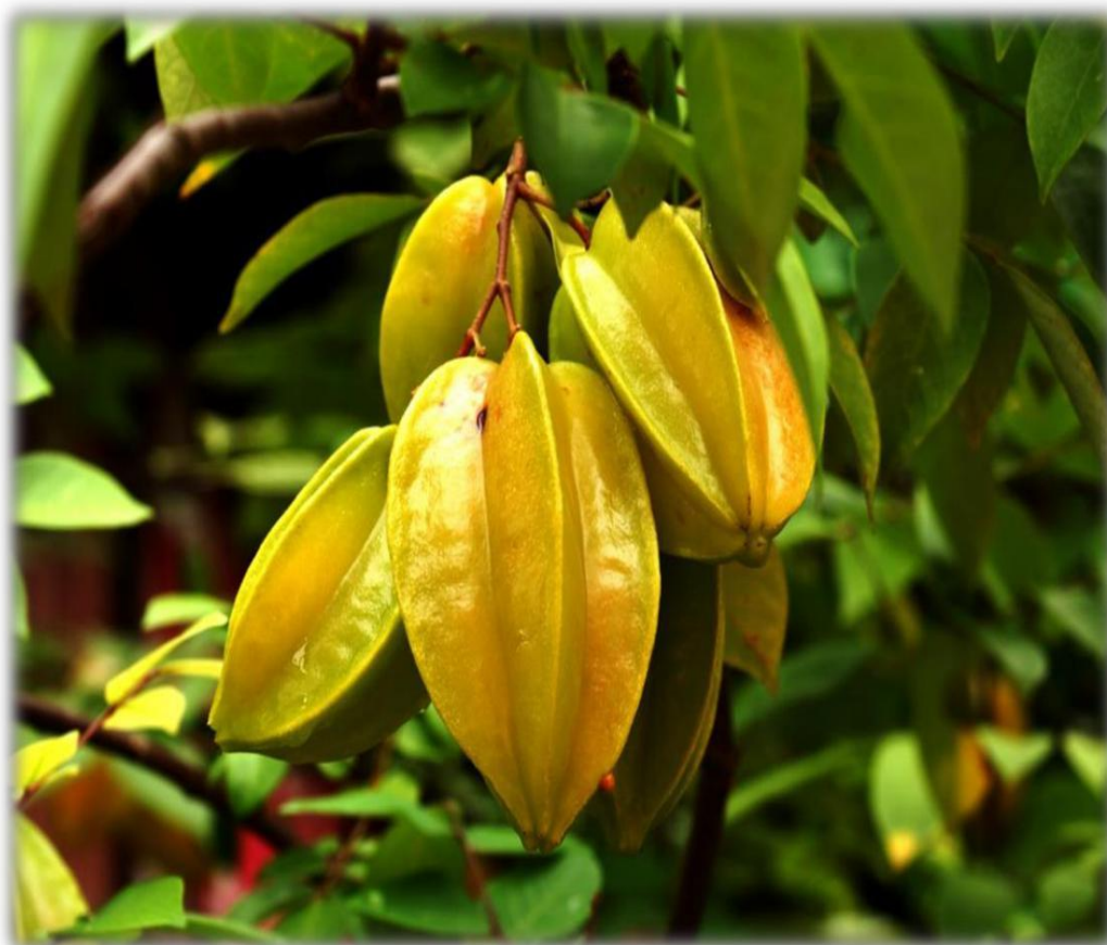
Figura 4: Carambola

La carambola posee un contenido de fibra soluble que le confiere propiedades laxantes, por su aporte de provitamina A (3 mg / 100g de fruto) y vitamina C (34.4 / 100 g de fruto), se recomienda su consumo a quienes presentan carencias de las mismas. Su componente mayoritario es el agua. Contiene pequeñas cantidades de hidratos de carbono simples, por lo que su valor calórico es muy bajo (SICA, 2007). La carambola es reportada con un bajo contenido de sodio y ácido, y rica en compuestos polifenólicos como epicatequina, pro antocianinas, carotenoides y vitamina C (Shui y Leong; 2004). La Tabla 4 muestra la composición proximal de la parte comestible de la carambola.