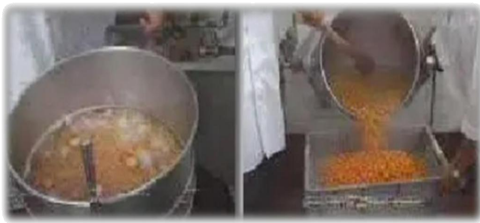
Figura 10: Escaldado