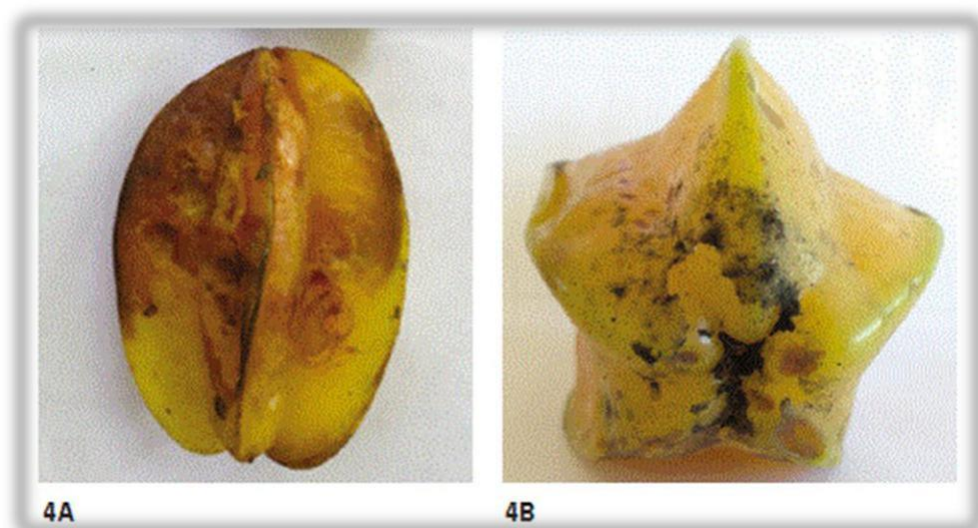
Figura 5: Variedades de Carambola