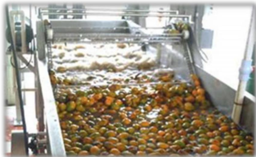
Figura 9: Lavado por aspersión

Son suministrados estas sustancias para la desinfección de la cascara como: hipoclorito de sodio (20-50 ppm; 0.05%-0.2%), o cualquier otro desinfectante adecuado existente en el mercado.