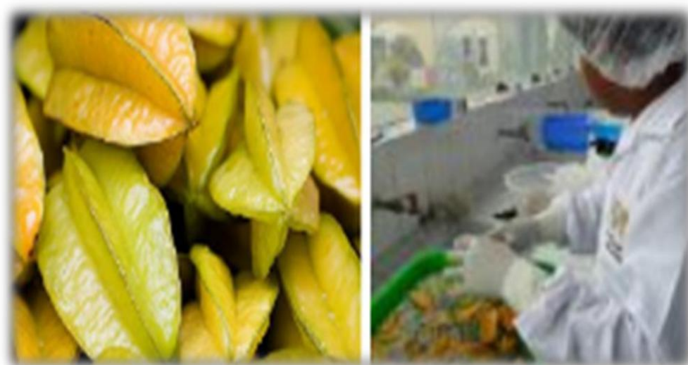
Figura 8: Clasificación

Después de la etapa de selección se procede a clasificar las frutas con el fin de tener una unificación de las frutas seleccionadas, de acuerdo a la especificación de la procesadora en las cuales se basan en el tamaño requerido, estado de madurez, °Brix, forma de las frutas, textura aparente, etc.). Esta se puede dar de manera mecánica, manual o en combinación de ambas.