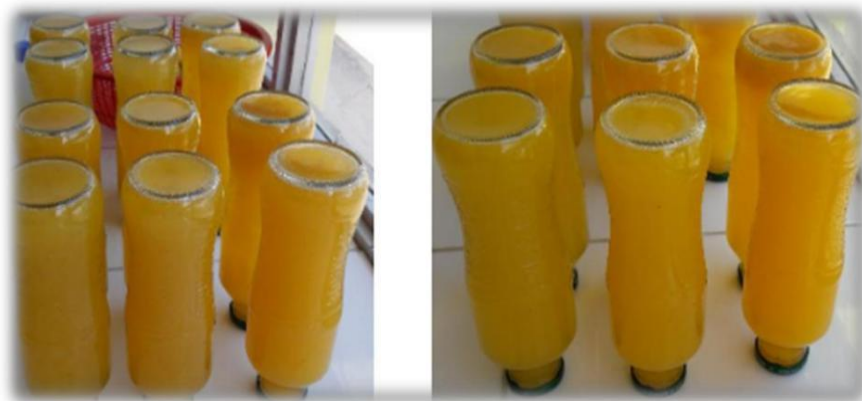
Figura 16: Envasado

Efectuado a temperaturas que no sean inferiores a 85°C. Debe realizarse de forma completa, que no se genere espuma pero debe quedar libre espacio de cabeza bajo vacío dentro del envase. (Torres 2011).