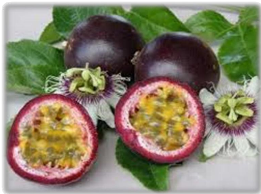
Figura 3: Maracuyá Morado