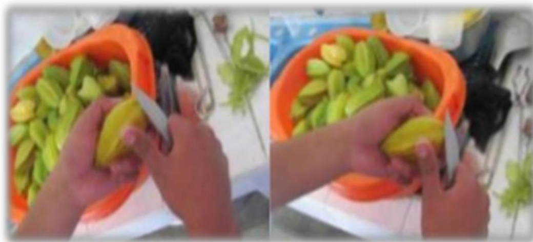
Figura 11: Pelado manual

El pelado puede ser ejecutada en forma manual, con soda, con agua caliente o vapor (Vargas y Pisfil, 2008).