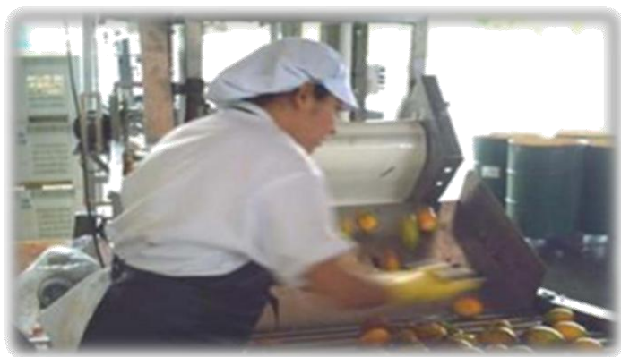
Figura 7: Selección