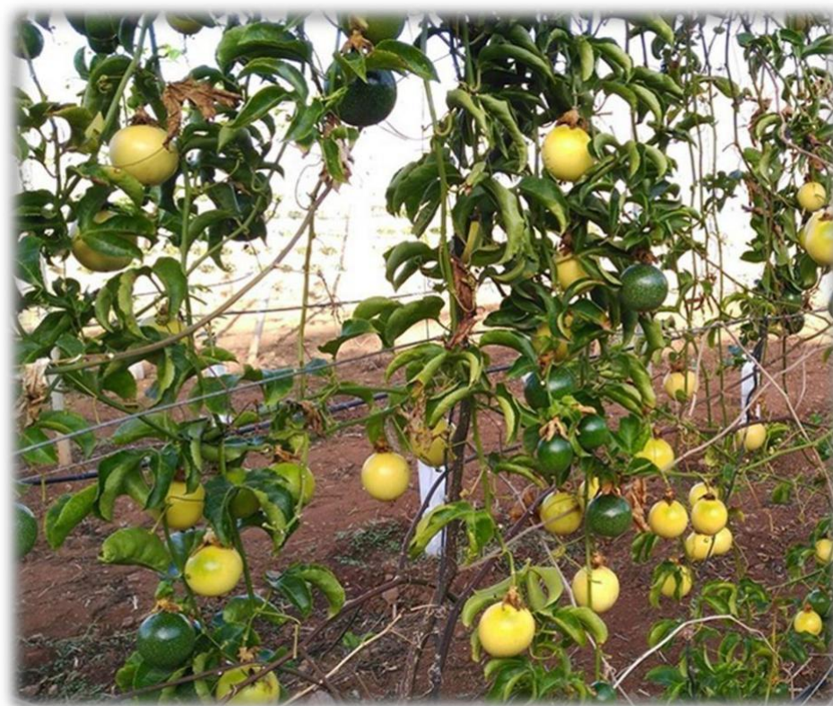
Figura 1: Maracuyá