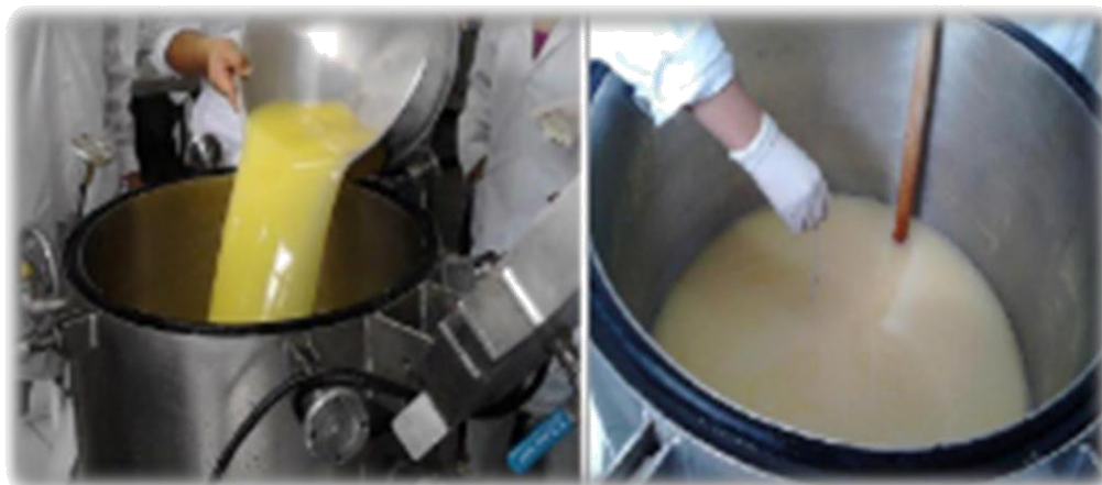
Figura 14: Homogenizado