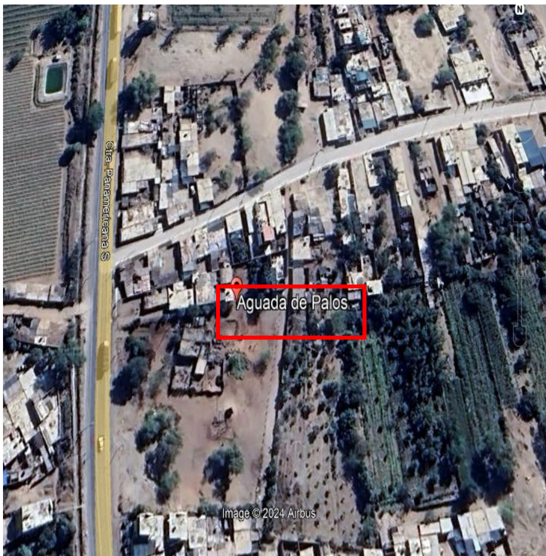
Fotografía 1: Google Earth Pro Ubicación del experimento