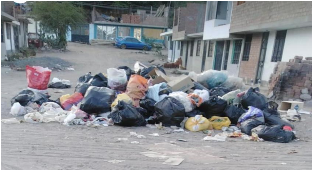
Figura 7 Calles del Pueblo joven Fernando León de Vivero

algunos empleados reaccionan de forma etérea. También se debe mencionar la mala práctica de algunos negocios, como restaurantes, que ofrecen a los trabajadores regalos u obsequios en agradecimiento a su labor, así como el hecho de que los negocios ambulantes en la zona cercana, y especialmente en la Panamericana Sur, arrojan sus desechos en las esquinas, generando puntos críticos.