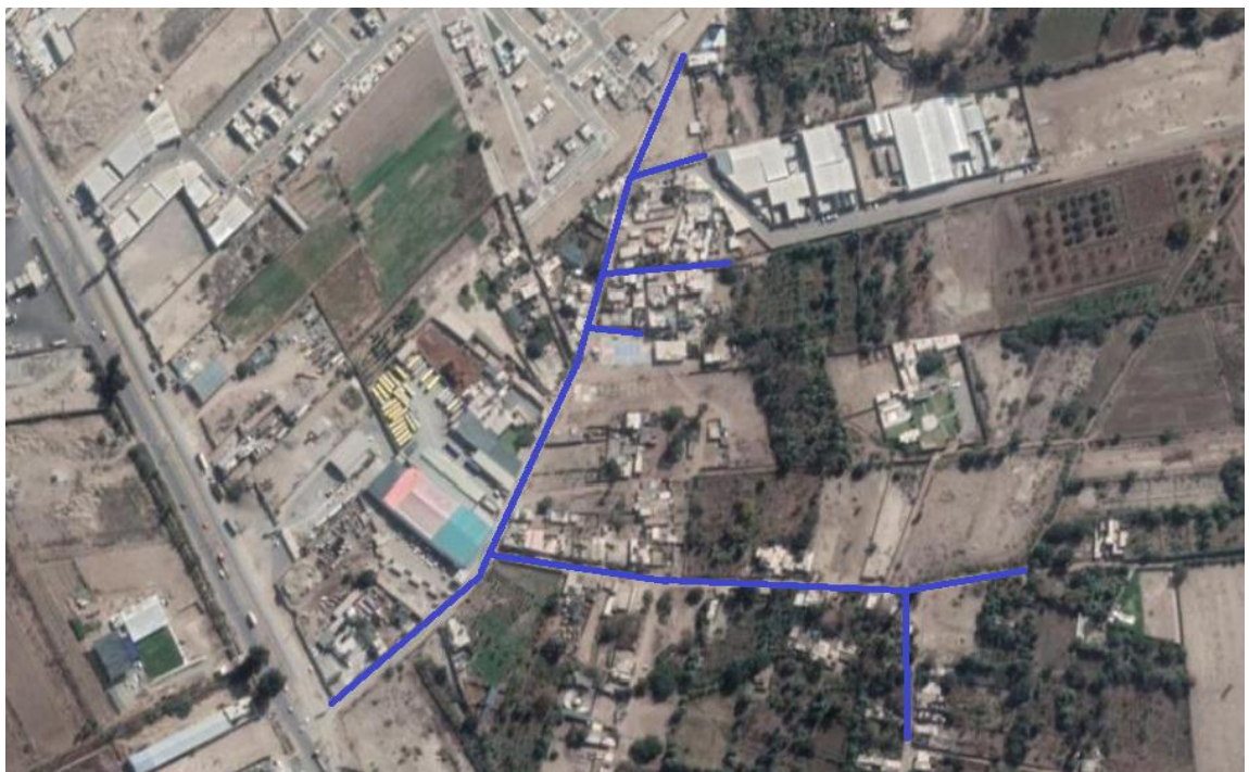
Figura 10 Zona 4 Servicio de recolección de residuos sólidos