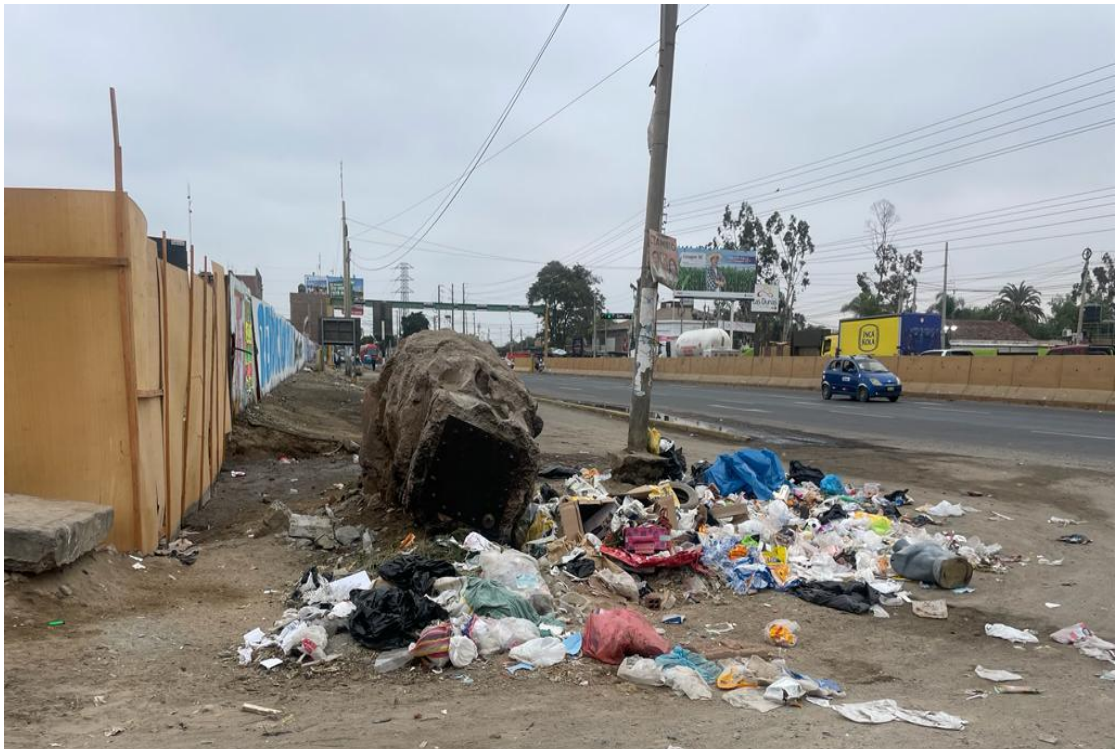
Figura 13 Calle cercana a la Panamericana Sur, Paradero el Álamo