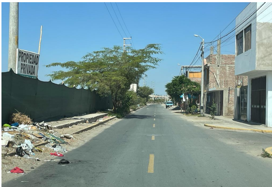
Figura 5 Calles del cercado del Distrito de Subtanjalla

Se identifica además que los negocios ambulantes de la zona del cercado y en especial de la Panamericana Sur depositan sus residuos en las esquinas generando puntos críticos, a esto se le suma la mala práctica de algunos negocios como restaurantes que les ofrecen a los trabajadores dadas o los trabajadores en agradecimiento por su labor, situación que no sucede en los demás sectores.