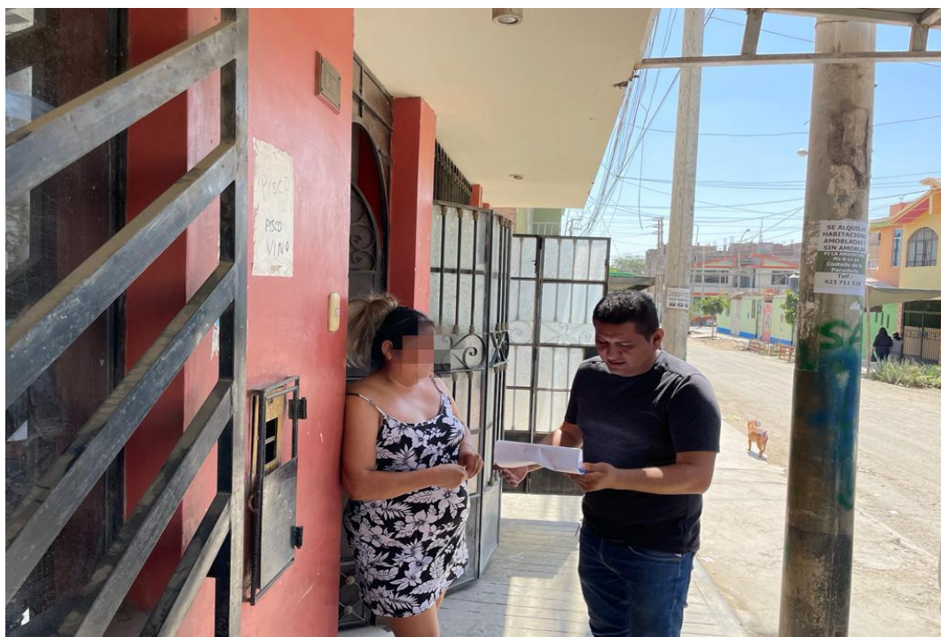
Figura 18 Entrevista a vecinos de la Urbanización la Florida