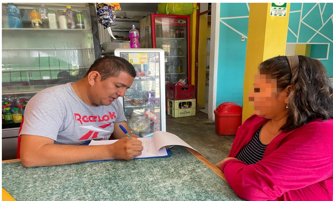
Figura 21 Entrevista a vecinos de Caserío Buenos Aires