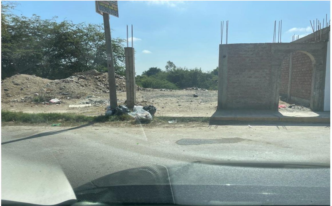
Figura 9 Calle de la Urbanización la Florida