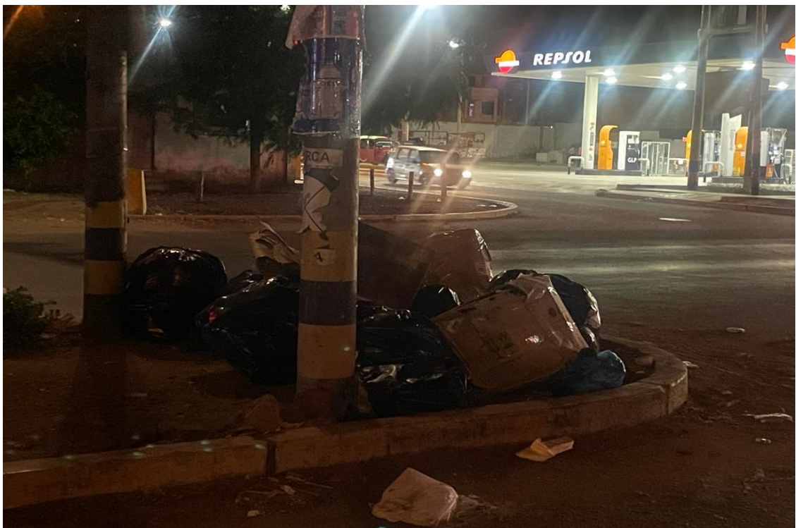
Figura 14 Carretera Panamericana Sur