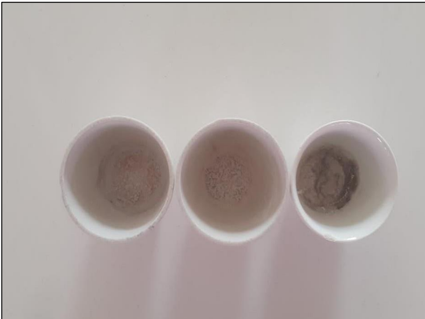
Figura 5. Cenizas totales de las semillas de Cicer arietinum (garbanzo).