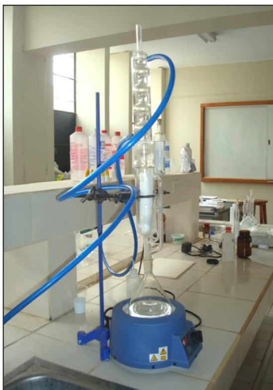
Figura 7. Extracción de grasas por método Soxhlet de las semillas de Cicer arietinum (garbanzo).