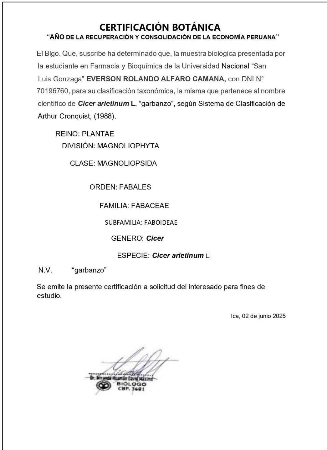
Figura 3. Certificación de Cicer arietinum (garbanzo).