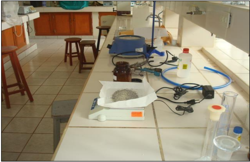
Figura 8. Peso de la muestra de las semillas de Cicer arietinum (garbanzo).