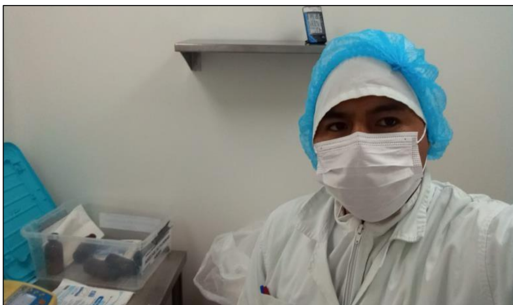
Figura 6. Preparación del protocolo para la evaluación del análisis proximal de las semillas de Cicer arietinum (garbanzo).