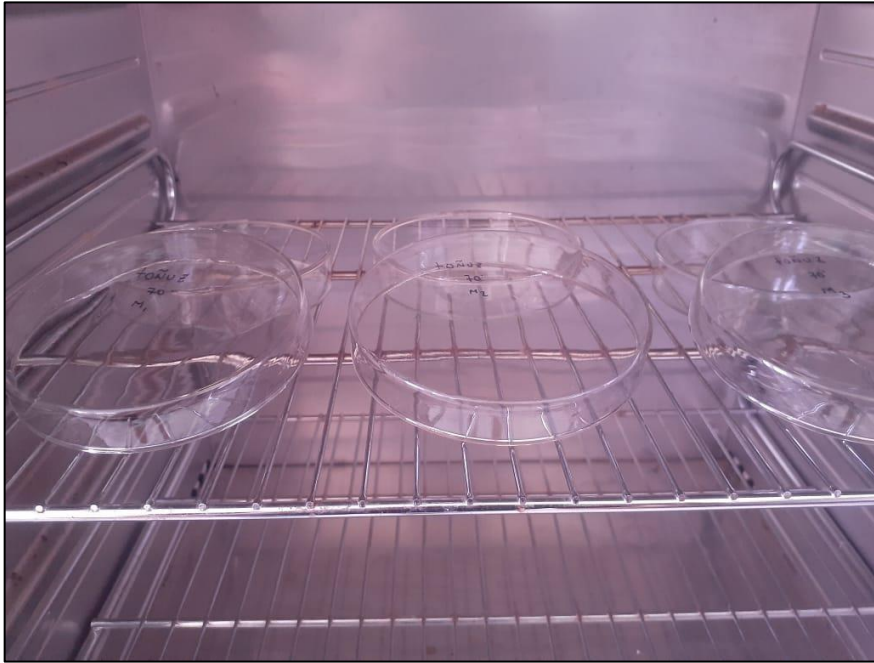
Figura 4. Acondicionamiento de placas Petri para el ensayo de humedad de las semillas de Cicer arietinum (garbanzo).