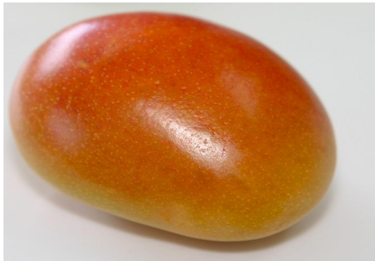
figura 2 Mango Chato de Ica