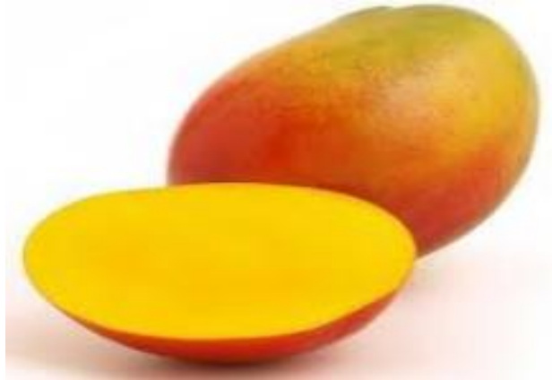
figura 3 Mango variedad Haden