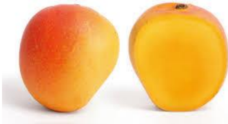
figura 4 Mango variedad Edward