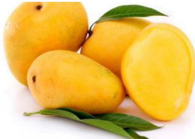
figura 1 El mango

Los mangos que aún están verdes deben almacenarse a temperatura ambiente hasta que alcancen su punto dulce. Guarde en el refrigerador antes de servir solo si desea comerlo frío y solo cuando necesite enfriarlo. (Frutas & Hortalizas s.f)