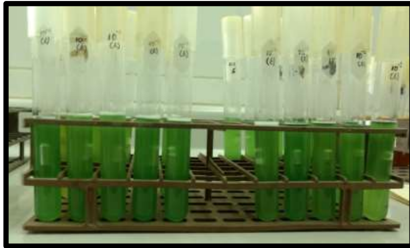
Fig. N°11: Tubos positivos en Caldo Lactosado Bilis Verde Brillante