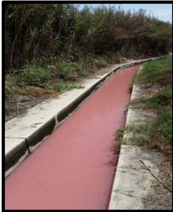
Fig.N°07: Canal del efluente