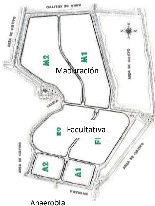
Fig. N°02: Lagunas de Estabilización “Boca de Río”