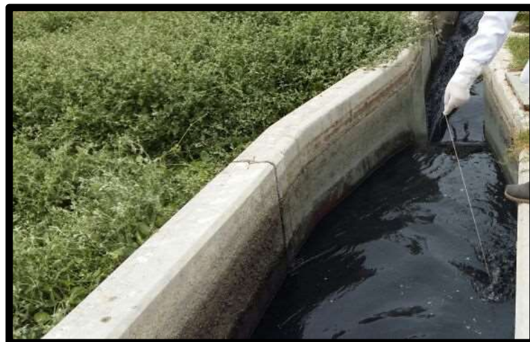
Fig. N°08: Toma de muestras