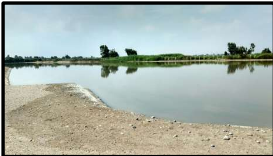
Fig. N°06: Laguna de Maduración