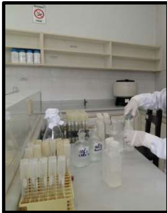
Fig. N°09: Preparación de medios de cultivo y diluciones