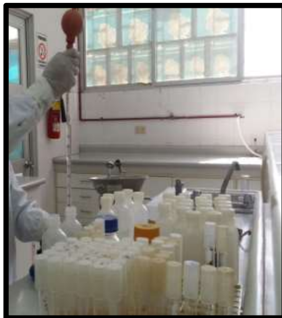
Fig. N°10: Procesamiento de las muestras