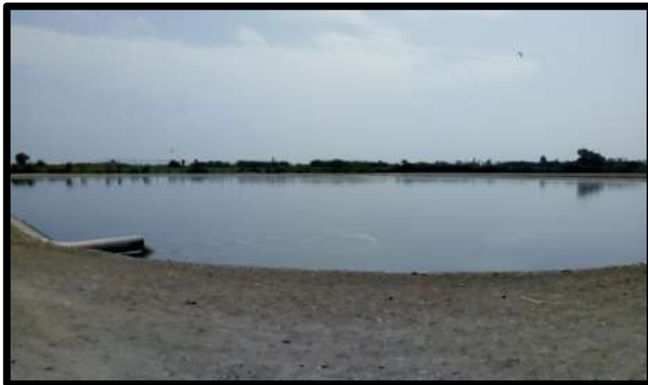
Fig. N°04: Laguna Anaerobia