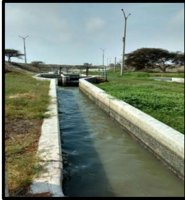
Fig. N°03: Vista del canal del afluente