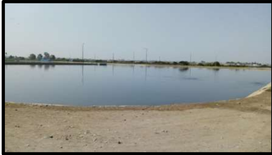
Fig. N°05: Laguna Facultativa